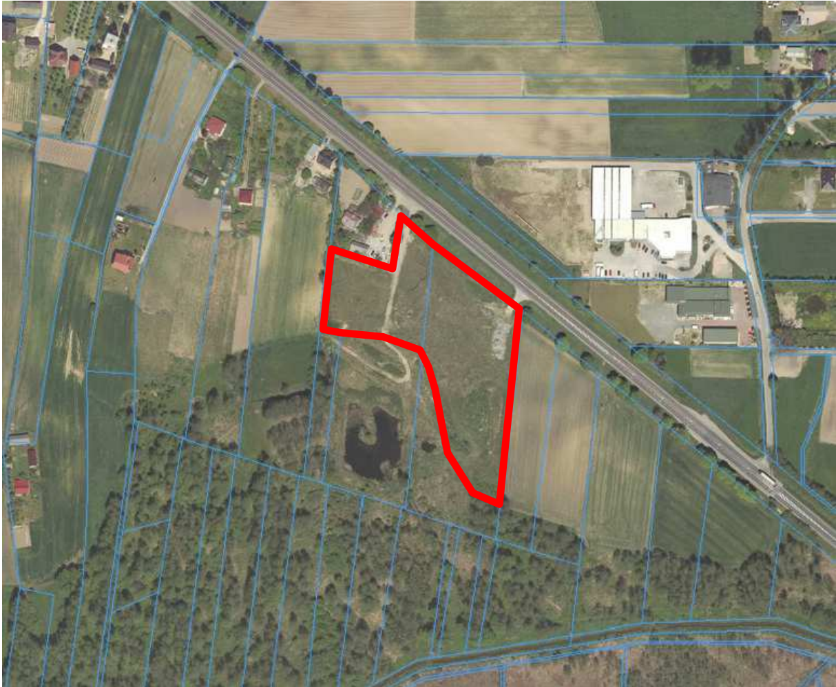
Rysunek 1. Granica obszaru objętego opracowaniem

Zgodnie z Planem Zagospodarowania Przestrzennego Województwa Lubelskiego gmina Jastków stanowi część obszaru metropolitalnego Lublina. Oznacza to, że rozwój gminy rozważać trzeba, jako proces uzależniony od koniunktury rozwojowej całości Aglomeracji Lubelskiej. Najczytelniejszy wpływ tych relacji widoczny jest w rozwoju sieci osiedleńczej. Gmina stanowi atrakcyjne miejsce dla realizacji zabudowy podmiejskiej dla osób związanych z Lublinem, jak i dla realizacji zabudowy rekreacyjnej, szczególnie w pobliżu dolin rzecznych i wąwozów.