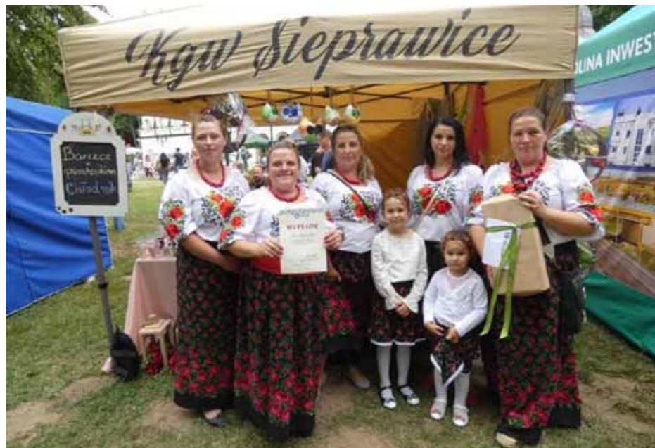
Na pierwszym Festiwalu Kół Gospodyń Wiejskich „Tradycyjnie w Nałęczowie”

Dla najmłodszych były „dmuchańce” i liczne atrakcje, więc do wieczora odbywały się gry, zabawy dla dzieci i dorosłych nagradzane cukierkami oraz zabawkami, roz-